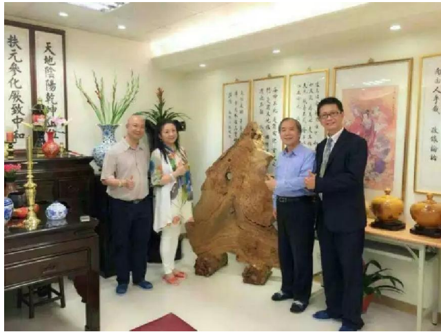
上图：蔡会长拜访包安科技集团

中华儒道研究协会于民国八十七年六月二十七日的成立，以推动传统儒家文化为己任，他们的宗旨是“圣哲依理 制礼作乐 文教乃兴 伦序乃成 道之以德 齐之以礼 操持有节 百业有序”。